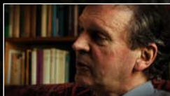
DR. RUPERT SHELDRAKE, BIOLOGIST, GREAT BRITAIN