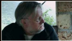
DIETER BROERS, BIOPHYSICIST, AUSTRIA AND GREECE